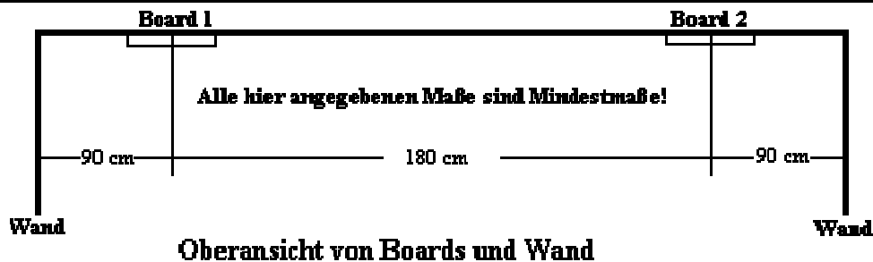
Abbildung 0.2: Oberansicht von Boards und Wand